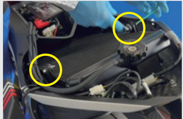
14.先ほど仮止めしたボルトを固定します