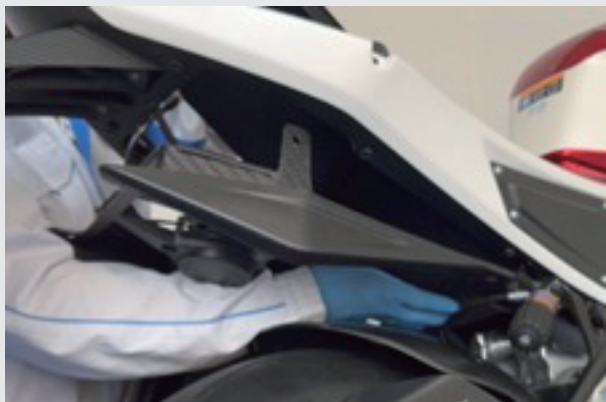
7.ラジエターカバーを取り外せます