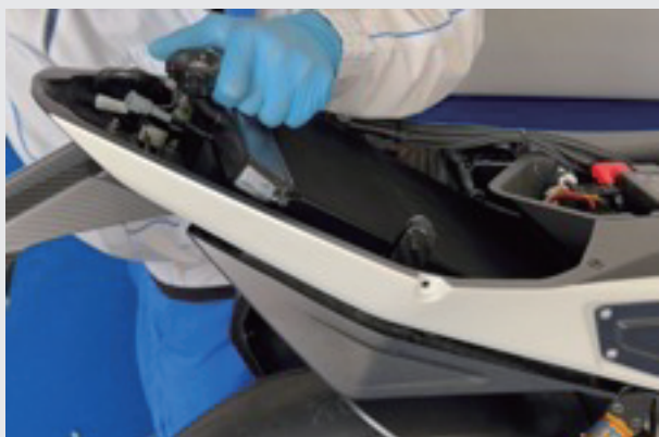
11.ラジエターカバーを取り付け