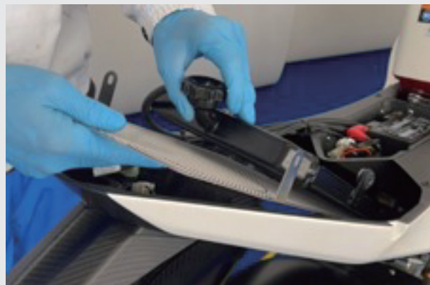
8.ラジエターを持ち上げ下からコアガードを入れます