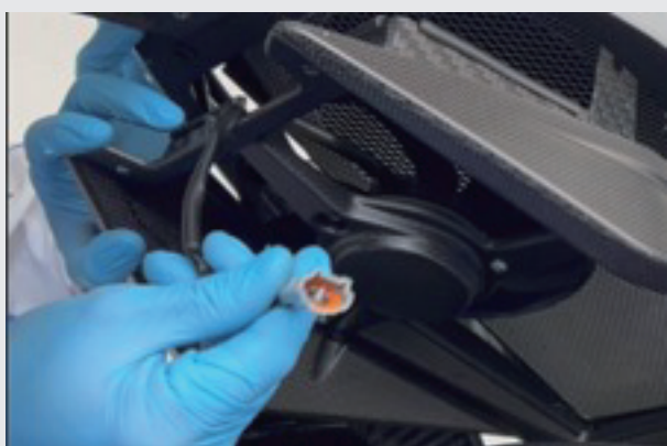
10.カップラーを中に戻します