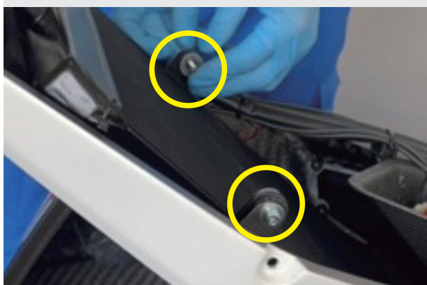
9.取り外したボルトを使用してコアガードを仮止めます。 (ナットはかけずボルトのみで仮止めます)