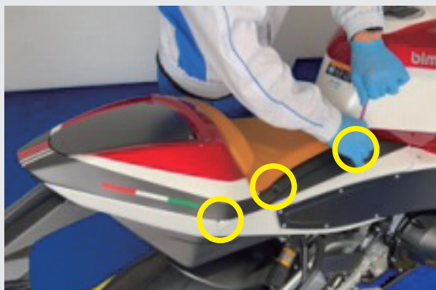
1.黄丸のボルトを取り外します