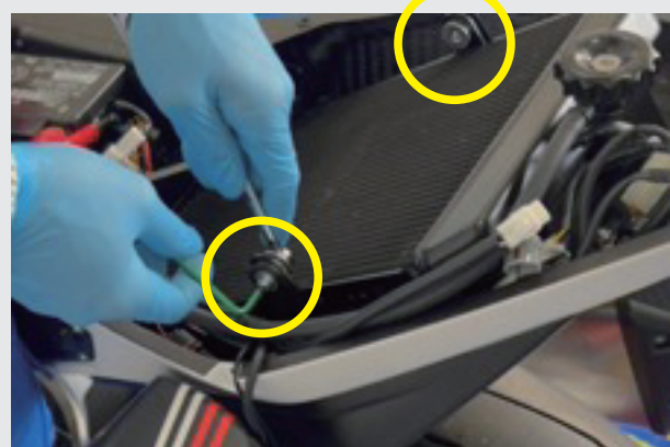
4.ラジエターを固定している ボルトを取り外します