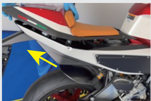
3.ボルトを取り外すとシートを取り外せ 後ろに引き上げて取り外します