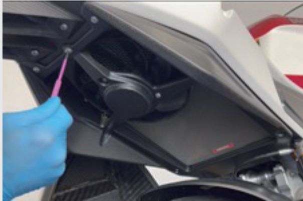
13.ラジエターカバーを取り外したボルトを使用して固定します