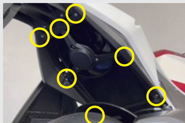
6.シート背面のボルトを取り外します 合計で7本あります