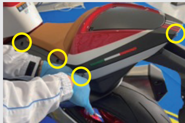
2.合計で7本取り外します